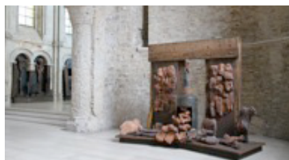
Choeur de lumière, Bourbourg