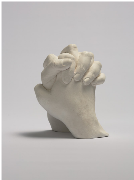
Frédérique Lucien, Précária , 2015 Plâtre composite, 15 x 13 x 10 cm © Frédérique Lucien