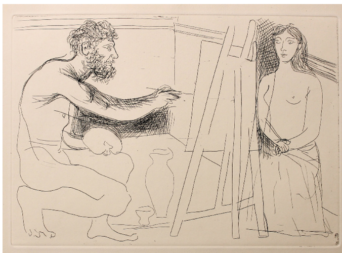
Planche extraite du Chef d'oeuvre inconnu 1927, Pablo Picasso

Qui est cet autre sous le regard de l'artiste ? La nature de leur relation influence-t-elle le sens de l'oeuvre ?