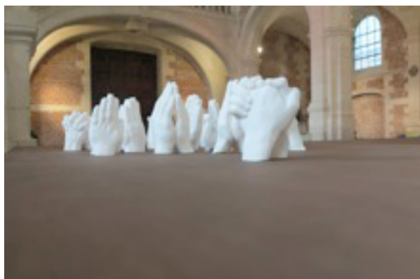
Frédérique Lucien, Præcaria , 2015, vue de l'installation dans la chapelle du collège des Jésuites à Eu © Frédérique Lucien