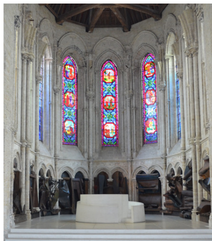
Choeur de lumière, Bourbourg