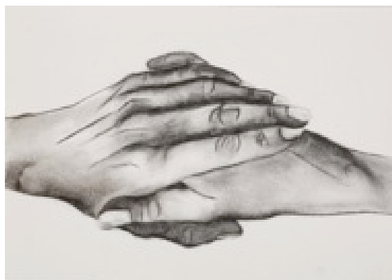
Frédérique Lucien, Main-trait , 2015, fusain sur papier, 18 x 29 cm © Frédérique Lucien

Dans le cadre de la manifestation "Cher modèle" proposée par le Musée du dessin et de l'estampe originale de Gravelines, le CIAC (Centre Interprétation Art et Culture) a invité l'artiste Frédérique Lucien à investir ses salles d'expositions mais également l'église Saint Jean-Baptiste à Bourbourg du 17 octobre 2015 au 6 mars 2016.