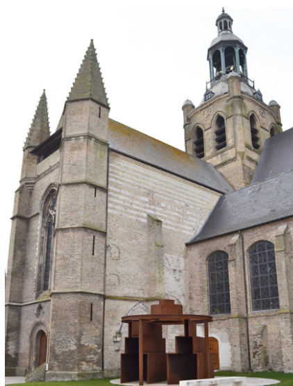
Choeur de lumière (seuil), Bourbourg