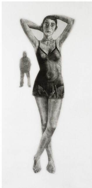
Agathe May, Joséphine - Les cracheurs I , 2007 Xylographie en noir et blanc, 175 x 61 cm Collection particulière

Les oeuvres ci-dessous ne sont pas libres de droits. A charge pour le diffuseur de s'en acquitter auprès de l'Adagp ou de la Succession Picasso.